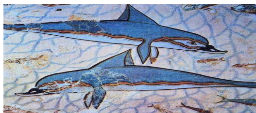
particolare di un affresco

Principe dei gigli (con collana di gigli e copricapo di piume di pavone)