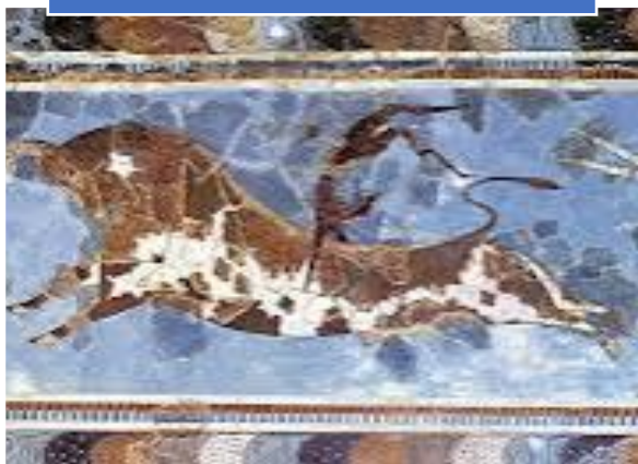
Dipinto trocato a Cnosso, esposto nel museo di Iraklion

I Cretesi erano politeisti, cioè, credevano in tanti dei, tra cui la grande Madre. Credevano anche nell' esistenza di esseri mostruosi come il Minotauro. Le loro divinità avevano sembianze umane; esistevano rappresentazioni di dei ibridi, cioè uomini con la testa di capra o donne con la testa di uccello. Le cerimonie religiose si tenevano all' aperto, intorno a degli altari, durante grandi feste: si svolgevano giochi, danze e acrobazie. Molto diffusa era la giostra del toro, un gioco acrobatico in cui dei giovani afferravano le corna di un toro in movimento ed eseguivano dei salti al di sopra dell'animale.