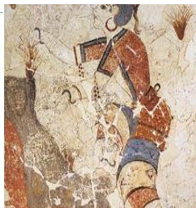
raccoglitore di zafferano