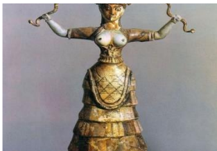
la dea dei serpenti

I Cretesi erano politeisti, cioè, credevano in tanti dei, tra cui la grande Madre. Credevano anche nell' esistenza di esseri mostruosi come il Minotauro. Le loro divinità avevano sembianze umane; esistevano rappresentazioni di dei ibridi, cioè uomini con la testa di capra o donne con la testa di uccello. Le cerimonie religiose si tenevano all' aperto, intorno a degli altari, durante grandi feste: si svolgevano giochi, danze e acrobazie. Molto diffusa era la giostra del toro, un gioco acrobatico in cui dei giovani afferravano le corna di un toro in movimento ed eseguivano dei salti al di sopra dell'animale.