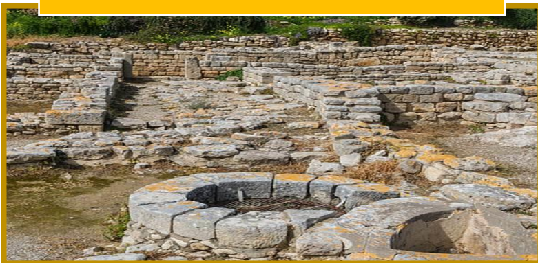
Scavi del palazzo di Festo- Creta

Il popolo CRETESE per costruire palazzi utilizzava materiali molto semplici da trovare in natura, come: LEGNO, PALTA, FERRO ECC.