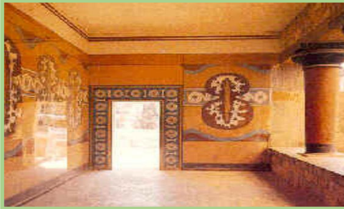
Interno palazzo di Cnosso

un'imparziale amministrazione della giustizia. A riprova di questo sono state trovate nei palazzi numerose armi appartenute ai guerrieri.