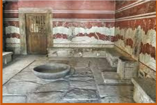
interno palazzo di Cnosso

abbiamo scarsi documenti; le notizie ci provengono soprattutto dai reperti archeologici. Da essi si intuisce, che nel periodo tra il 2600 e il 2000 a.C. circa, la società cretese sviluppò la propria ricchezza senza